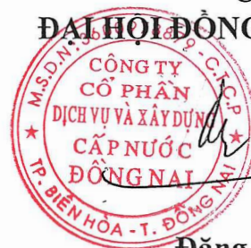
Đặng Trọng Thành